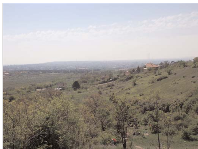
Panoráma a Fundoklia-völgyből

Április 26-án, a Föld-napja alkalmából Érd Megyei Jogú Város Önkormányzatának Környezetvédelmi Bizottsága , az érdi Környezetvédő Egyesület , a Civil ÉRDek Meggyesek , az ÁNTSZ érdi munkatársai, az Ága-Boga Nagycsaládosok Érdi Egyesülete a Fundoklia-völgyben, a Pincetulaajdonosokkal Érd-Ófaluért Egyesület , a Szent Mihály Alapítvány , és a Horgász Egyesület a Beliczay-szigeten szervezett takarítási akciót.