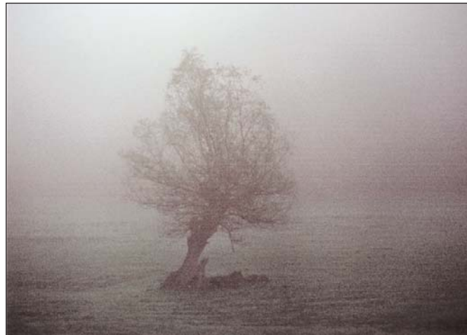
Tulogdi Áron – III. díj