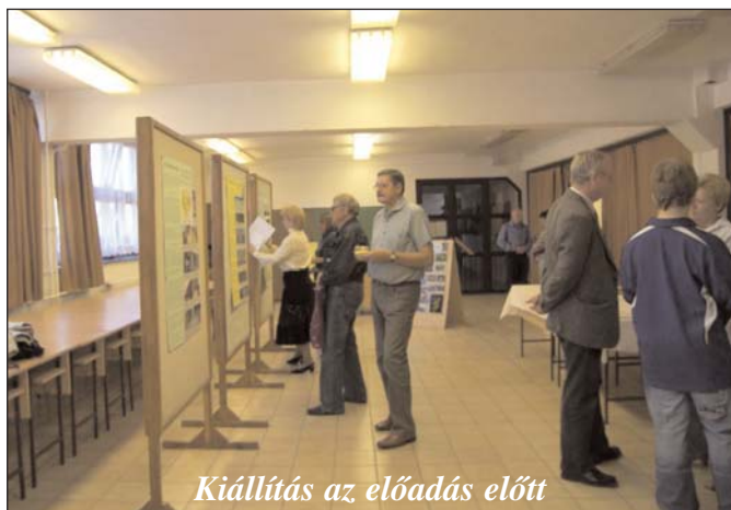
Kiállítás az előadás előtt