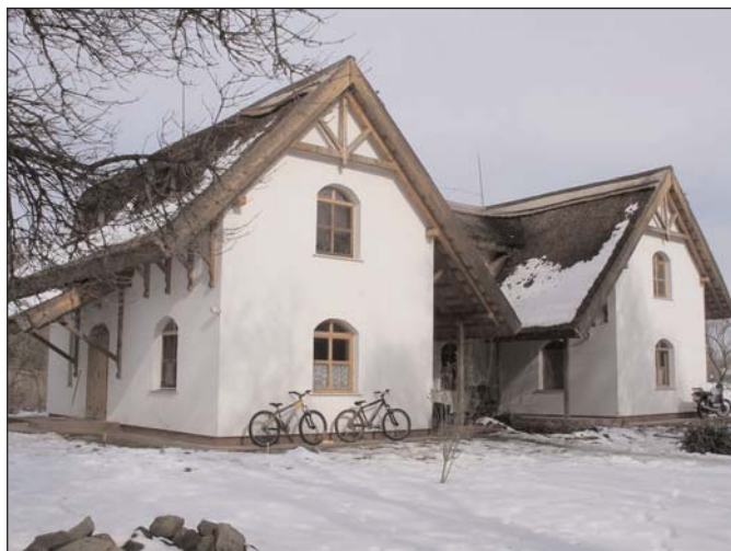
Madárvárta a tűz előtt

Január közepén, a télre hiába várva, a média által „közelgő világvégeként” aposztrofált szélvihar elmúltával, új hír borzolta a hazai természetvédő és madarásztársadalmat: leégett Ócsán a madárvárta.