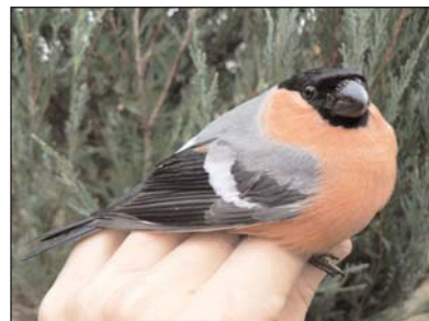
Téli vendég a süvöltő