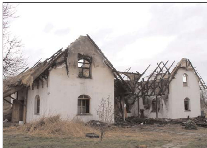
Madárvárta a tűz után

A cél egy olyan monitoring létrehozása, amely egyebek mellett rámutat különböző fajok egyedszám- és arányváltozásának, valamint kor és ivarstruktúrájának, az egyedek kondícióváltozásának vizsgálata, a területhűség feltérképezése. 1999-től az adatgyűjtést – az Eötvös Loránd Tudományegyetem kutatóinak bevonásával – a vízkémiai paraméterekre, a vegetáció összetételére, néhány gerinctelen állatcsoportra és a