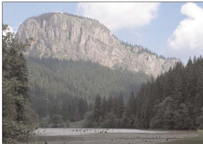
A Gyilkos-tó a Kis-Cohárddal

A Gyergyói-havasokból valósággal legurultunk a Gyilkostóhoz. Gondolom nincs olyan ember hazánkban, ki ne hallott volna erről a tóról, hiszen még a földrajz tananyagban is benne van. A tavak keletkezésének egyik iskolatípusa, a patakmeder hegyomlással történő elgátolódása duzzasztotta fel a vizet. Az elárasztott hajdani fenyves törzsei még így másfél évszázad után is meredeznek a vízből. Még ugyanennyi idő, és a patak feltölti hordalékával a medret, a tó eleinte mocsárrá, elzártabb részei láppá alakulnak, majd újra erdő fog nőni a völgyben. Ha