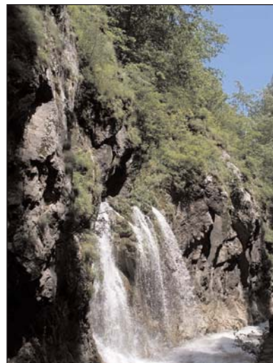
Vízésés a Békás-szorosban