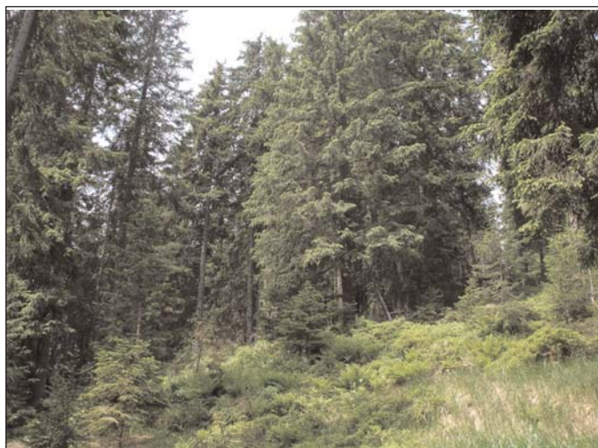
Igazi kárpáti lucos

Az előző írásomban a Görgényi-havasok alacsonyabb részeinek növényzetéről, illetve a Sóvidék természeti képéről adtam egy kis ízelítőt, most képzeletben feljebb kapaszkodunk, a Kárpátok gerinceire.