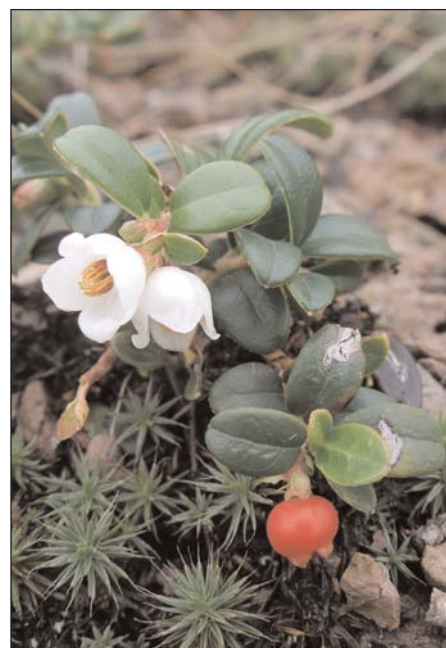
Virágzó és terméző vörös áfonya